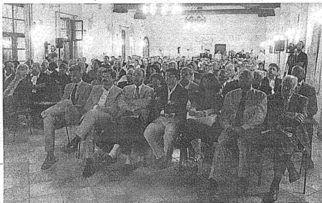
La platea dell'assemblea generale di Apindustria che si è tenuta ieri a Villa Schiarino