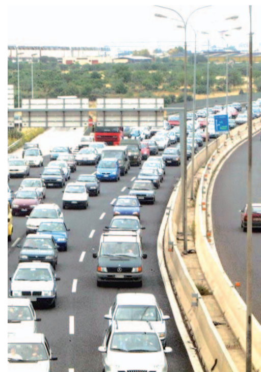
CODE Frequenti gli ingorghi sulla «16»

Va detto, inoltre, che per la tangenziale l'Anas ha avviato da tempo la progettazione del nuovo bypass che dovrebbe consentire l'abbattimento di un consistente volume di traffico sulla nostra tangenziale attraverso il raccordo Japigia-Mola. L'iniziativa è stata presentata dal presidente nazionale dell'Anas, Ciucci, nel corso della scorsa edizione della Fiera del Levante.