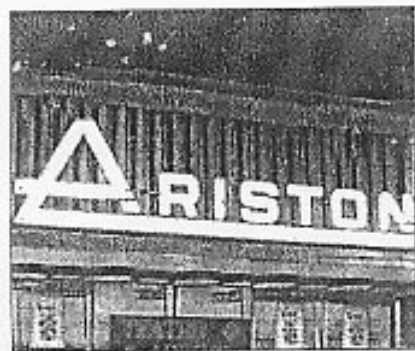
Il Teatro Ariston di Sanremo